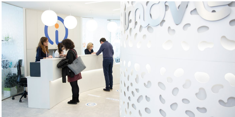
Recepció d'iMove Trauma al Campus de la Clínica Mi Tres Torres.

als nostres professionals perquè se sentin atesos, segurs i gairebé com a casa.